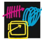
Halle 9 Stand 370